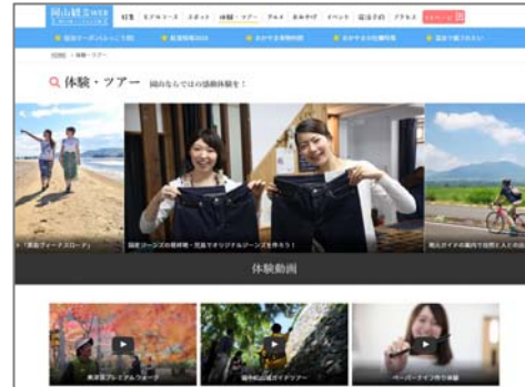
(体験・ツアー紹介)