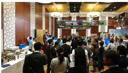
(晴れの国おかやま観光プレゼンテーション)