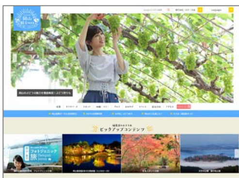
(岡山観光WEB トップページ)

サイト開設から9年あまり経過した「おかやま旅ネット」を全面リニューアルし、岡山県公式観光サイト「岡山観光WEB」として9月25日に公開した。新たに、人工知能(AI)によるモデルコース作成機能やレコメンド(おすすめ)機能、岡山ならではの「体験・ツアー」をレポートや動画形式で紹介するコーナーを盛り込むなど、周遊型観光並びに滞在型観光を促進するとともに、現在地に近い観光スポットや宿泊・食事施設を検索可能にするなど、スマートフォンでも使いやすいサイトに刷新した。