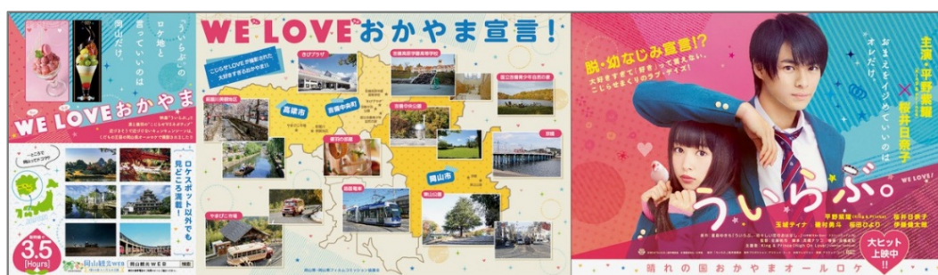
(JR新宿駅でのタイアップ看板)