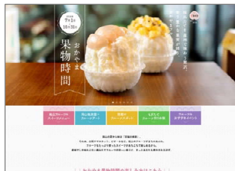
(おかやま果物時間 特設ページ)