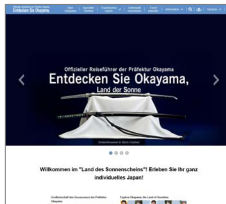
(ドイツ語版サイト)

1人あたりの観光消費額が高いと言われるドイツからの観光客に対し、本県の魅力を発信するため、ドイツ語版サイトを新設した。