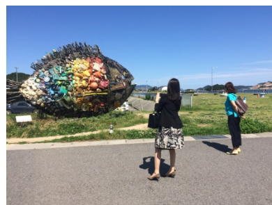
(宇野港 クラブツーリズム名古屋)