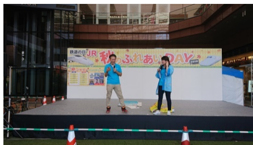
(JR 秋のふれあい DAY2018)