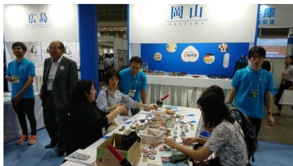
(ツーリズム EXPO 2018)