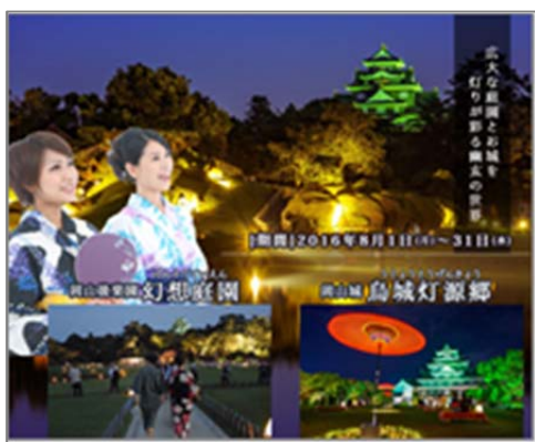
(幻想庭園・烏城灯源郷)