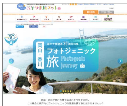
(岡山・香川フォトジェニック旅)