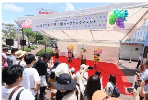
(「おかやま果物時間」オープニング)