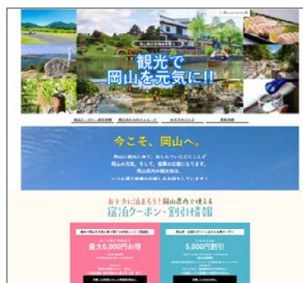
(岡山観光復興ポータルサイト)