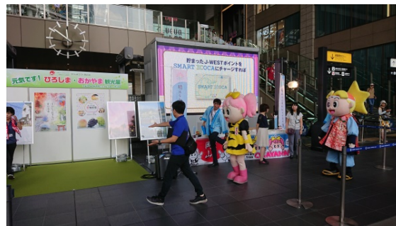
(ひろしま・おかやま観光展)