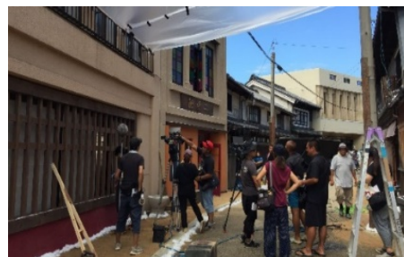
(この世界の片隅に)